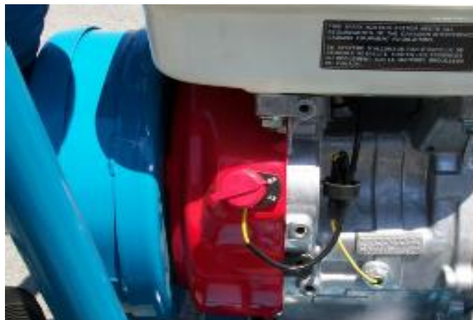
Fig. 6 Interrupteur

Tester l'interrupteur d'arrêt pour vérifier le bon fonctionnement (fig. 6). L'interrupteur est situé à l'arrière du moteur Honda.