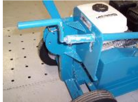
Fig. 5 Levier d'ajustement en position d'opération

Tester l'interrupteur d'arrêt pour vérifier le bon fonctionnement (fig. 6). L'interrupteur est situé à l'arrière du moteur Honda.