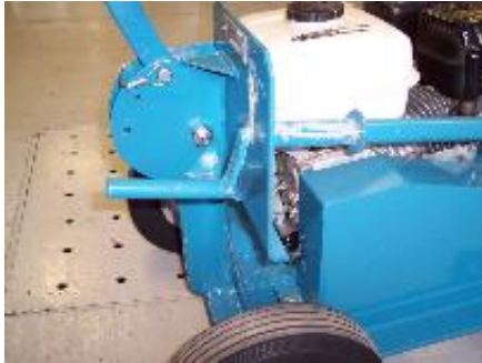
Fig. 4 Levier d'ajustement en position de repos

Le levier d'ajustement (fig. 4 et fig. 5) est situé sur le côté droit des poignées. La figure 4 montre le levier d'ajustement en position de repos et la figure 5 en position d'opération. Tourner le levier dans le sens des aiguilles d'une montre pour ajuster la profondeur de coupe et l'inverse pour remonter la lame. L'opérateur doit être familier avec cette opération avant d'effectuer des travaux avec la Mini coupeuse.